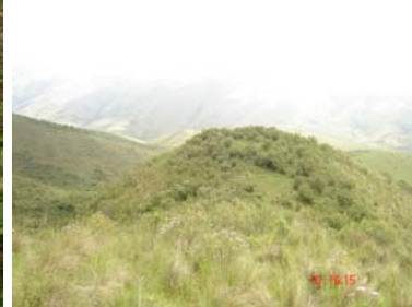
Vista panorámica del paisaje donde se asienta el sitio.