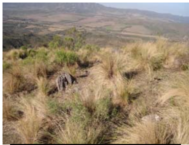
Vista de una estructura apenas visible por la depositación