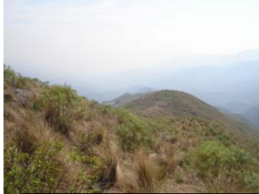
Detalle de muro Este