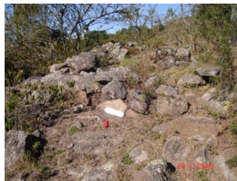
Vista de la pared norte de la estructura 1 (la mejor conservada de todo el sitio).