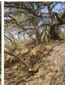
Vista de barranca donde se asienta el muro Sur