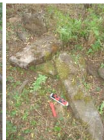
Algunas jambas de gran tamaño