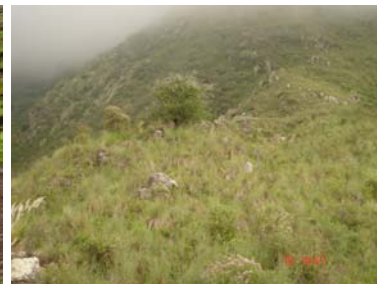
Vista general de la estructura