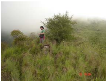
Vista de la estructura