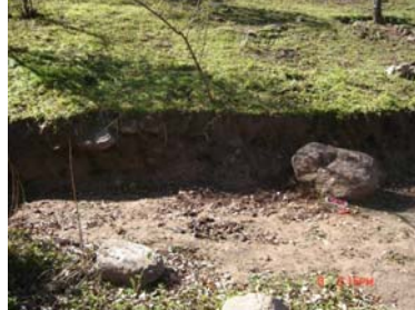
Vista general de la dispersión cerámica