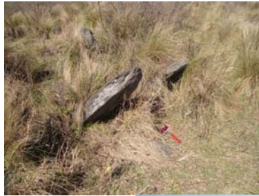
Muro Este, donde se puede apreciar la técnica de piedras paradas