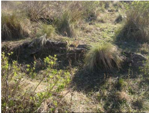
Parte de una terraza de cultivo