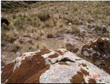
Vista general del sitio