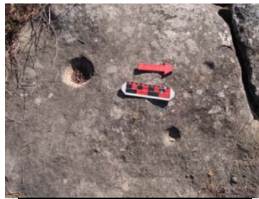
Vista del mortero asociado al sitio