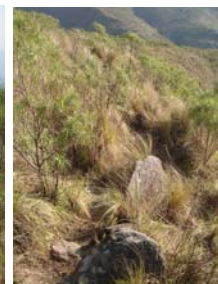
Detalle del muro Norte