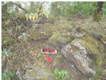
Técnica constructiva de la estructura