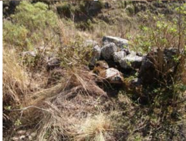
Vista del Muro interno al Este de la estructura