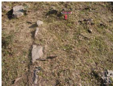
Vista de la esquina visible del sitio.