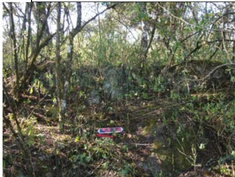
Vista de un muro de contención asociado a una estructura cuadrangular