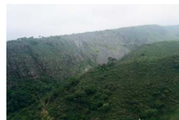
Vista general de la topografía donde se asienta la estructura