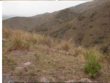
Vista general del sitio mirando a la Cumbre de Balcosna