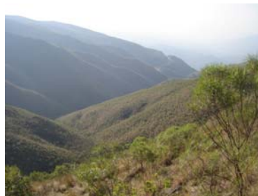
Vista del paisaje desde el sitio