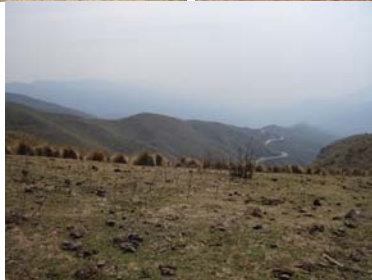
Morteros asociados al sitio