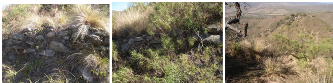
Vista de una terraza de cultivo