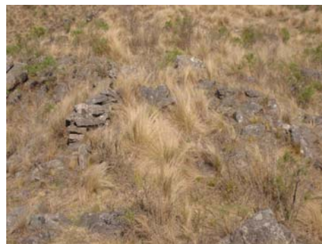
Vista del recinto semi-circular abierto