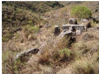
Vista del muro Oeste