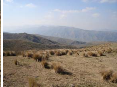
Vista del paisaje donde se asienta el sitio