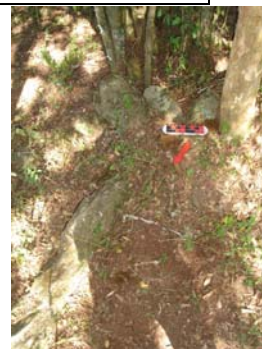
Vista de una estructura abierta