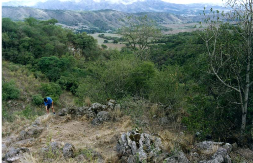
Vista general de la estructura N° 1 y en paisaje en general donde se asienta todo el sitio