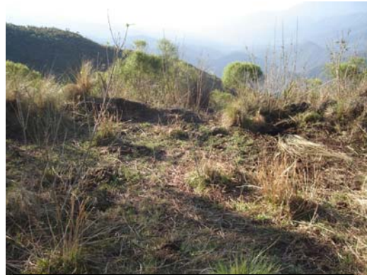
Muro interno Este