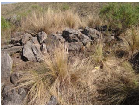
Vista de un muro interno de un recinto