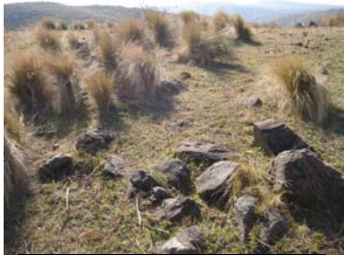
Vista de la estructura en general