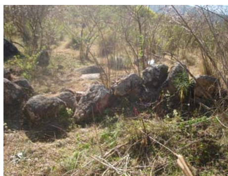
Vista de la pared sur de la estructura asociada al arroyo.