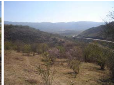
Vista hacia el valle desde el sitio