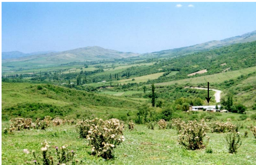
La flecha indica la casa donde se descubrió el Suplicante