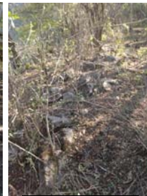
Detalle del muro Sur