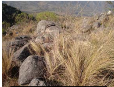
Detalle de muro