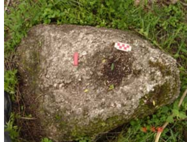
Mortero asociado en la esquina sureste