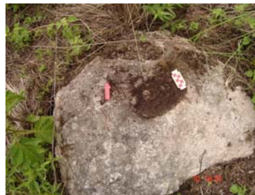
Mortero asociado dentro de la estructura