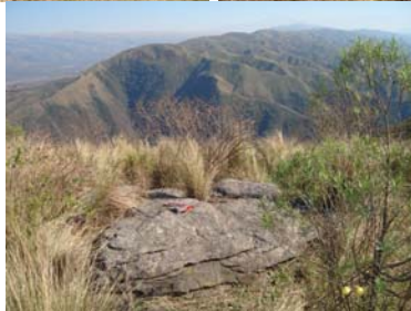
Vista general del pequeño recinto