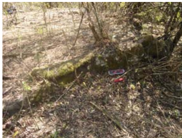
Detalle de muro de contención