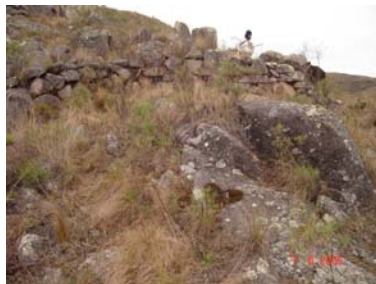
Vista del muro Oeste