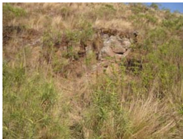
Vista de una barranca donde se asienta el muro Sur