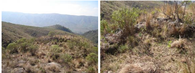
Vista general del sitio y el paisaje donde se asienta