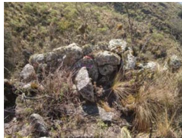
Vista del muro Este