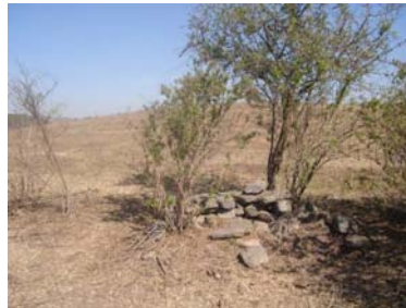
Parte de recintos que fueron extraídos por el arado