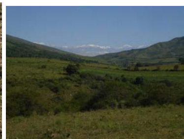
Vista del paisaje en general donde se asienta el sitio