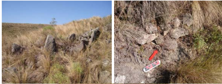
Muro Norte de la estructura cuadrangular