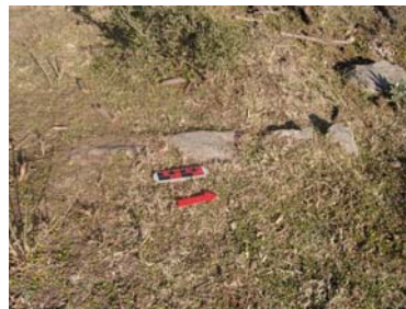
Muro Oeste del sitio