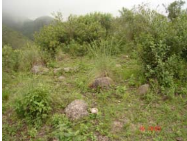
Vista general de la estructura