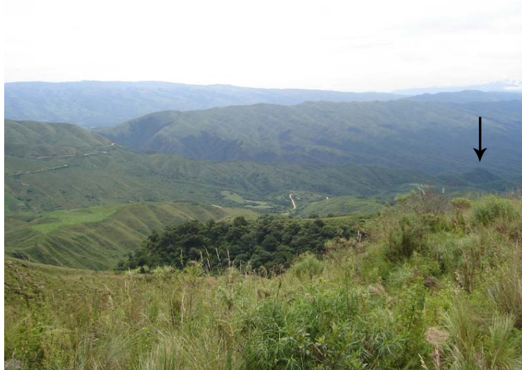
La flecha marca donde se encuentra el sitio, en el extremo izquierdo se encuentra la Unidad de prospección del Paso Natural