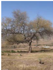
Bajo el Churqui se produjo en hallazgo del "Menhir"