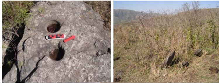
Morteros asociados al sitio