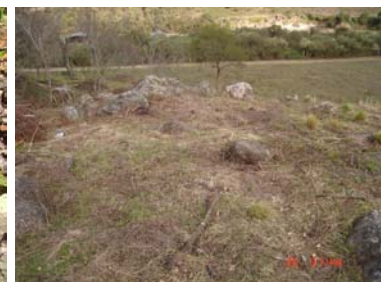
Vista de algunas estructuras del sector Oeste