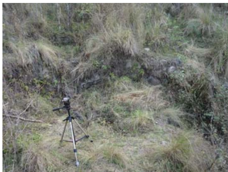
Vista de un embalse típico de un arroyo encausado para en control del agua