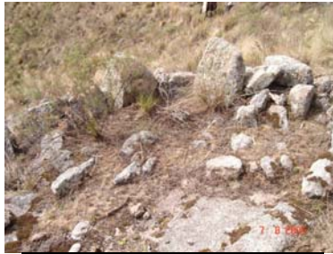
Vista de la esquina sureste del sitio