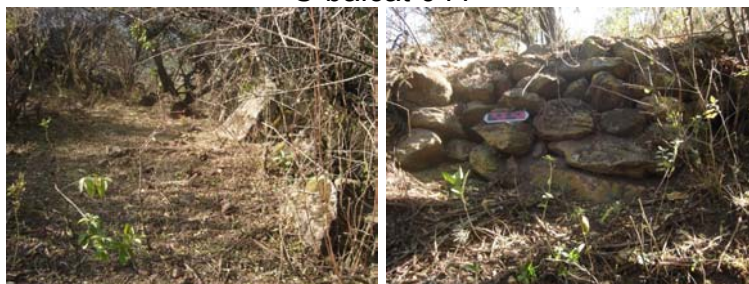
Vista interior del sitio