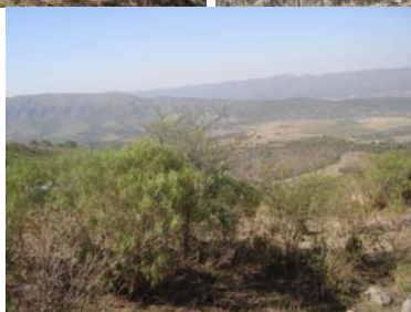
Vista general del sitio