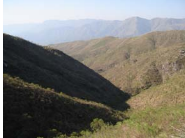
Vista general del sitio