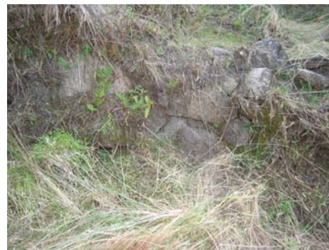
Vista del trabajo de la pared del arroyo