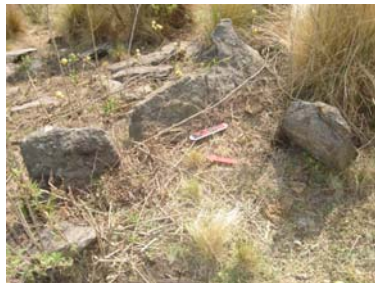
Detalle de la esquina del muro sureste