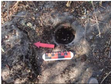
Mortero asociado al muro Este