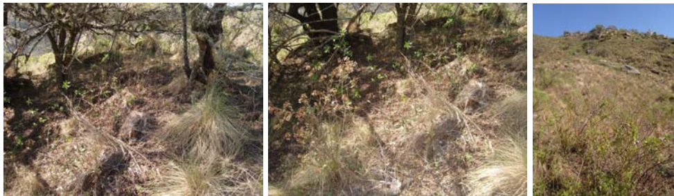
Vista general del sitio