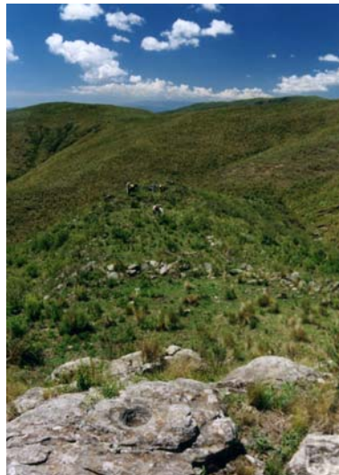
Vista general del sitio