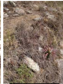
Vista de una terracea del sitio