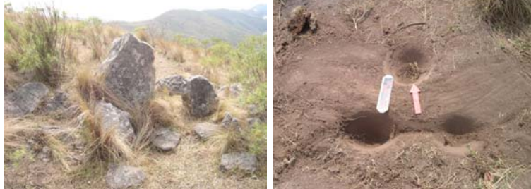
Detalle del muro Norte