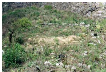
Vista general de la estructura cuadrangular