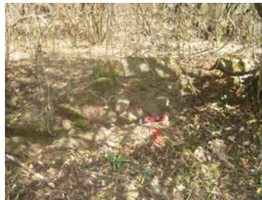
Vista del muro Norte