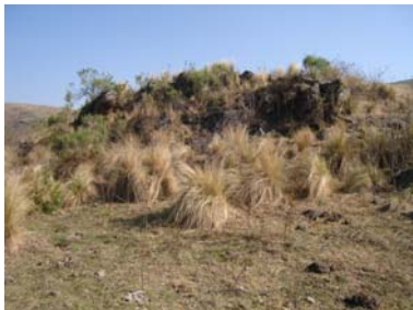
Muro Oeste donde se asienta la estructura