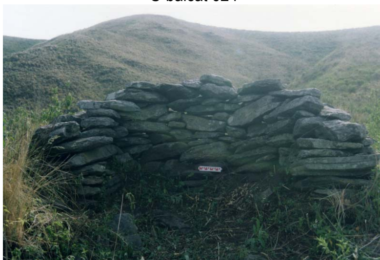
Detalle de la esquina sureste de la estructura 3. (la mejor conservada en toda la zona)