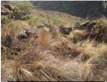
Vista del muro Norte