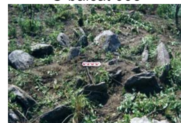
Posible estructura asociada