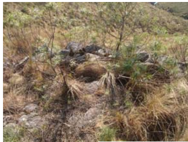
Detalle de un muro