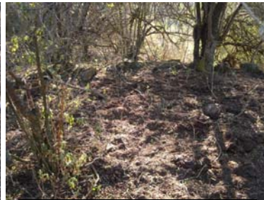
Vista general del sitio