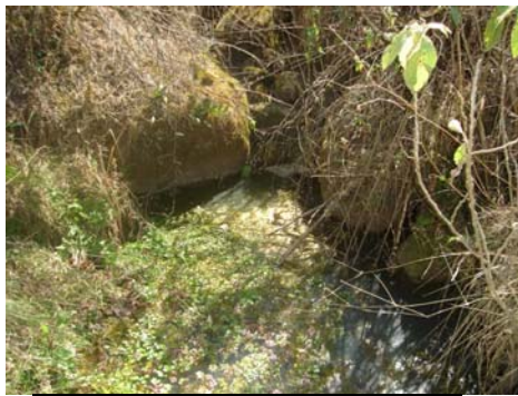
Pequeño dique aun con agua