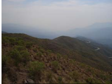
Vista general del sitio