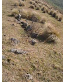
Vista del recinto anexo