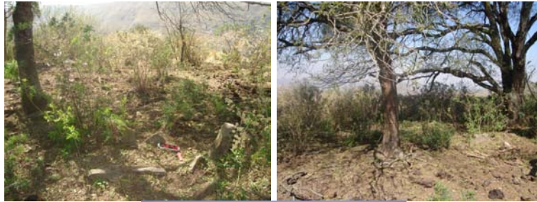
Vista de la estructura 1