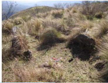
Vista de un mortero junto al paisaje de Singuil (Ambato) que se puede ver desde el sitio