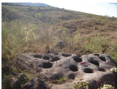
Roca granítica con 14 morteros asociado al arroyo