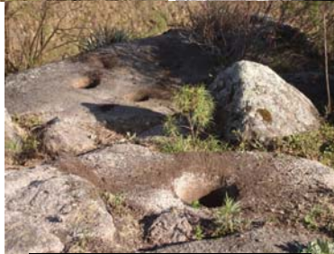
Parte de una terraza de cultivo vinculada a la estructura