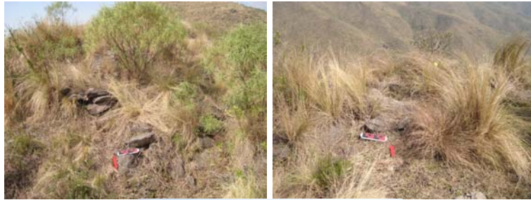
Detalle de muro Norte