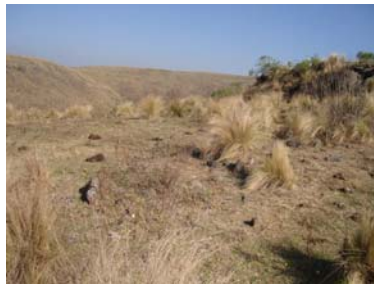
Vista en general de la estructura