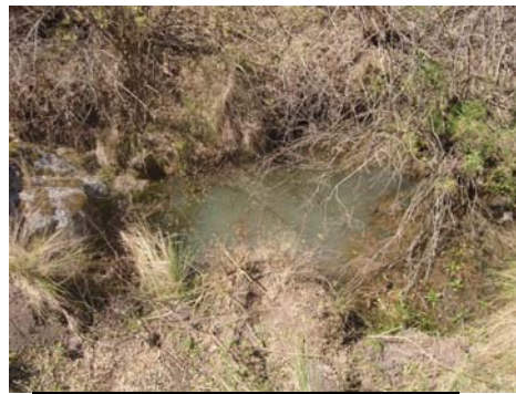
Pequeño dique aun con agua