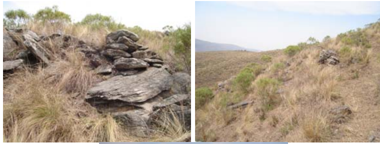
Detalle de un muro