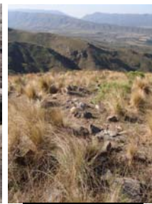
Detalle del muro Norte