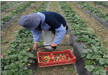
Imagen 1: Mujer boliviana cosechando frutilla en Lules

Las tareas relacionadas con la plantación se inician en marzo con la preparación de las parcelas, arado y armado de los bordos o camellones. Sobre estos se colocan las cintas de riego y se