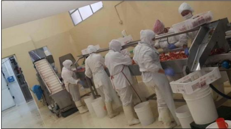
Imagen N° 2: Mujeres trabajando en el empaque La Loma en San Isidro de Lules