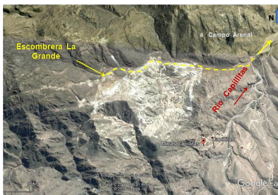
Figura 2: Ubicación de la escombrera y drenaje

Dentro del área de concesión minera se relevaron varias escombreras de distintos tamaños, no obstante, para esta investigación se estudió la escombrera La Grande, cuyo arroyo de régimen temporario desemboca en el río Capillitas. Estos aportes en definitiva terminan incorporándose por circulación subálvea a la cuenca de agua subterránea de Campo del Arenal, sector Sureste. (Figura 2) [4]