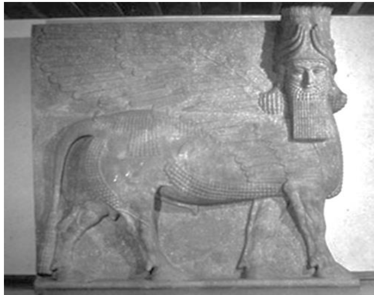
Fig. 2. Toro alado (Lamassu) de Palacio de Sargón II en Khorsabad, Iraq (Oriental Institute Museum)