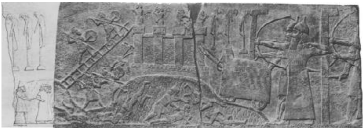
Fig. 4. El asedio de Upa, como se muestra en la decoración de la pared del palacio de Tiglath-pileser III en Kalhu.