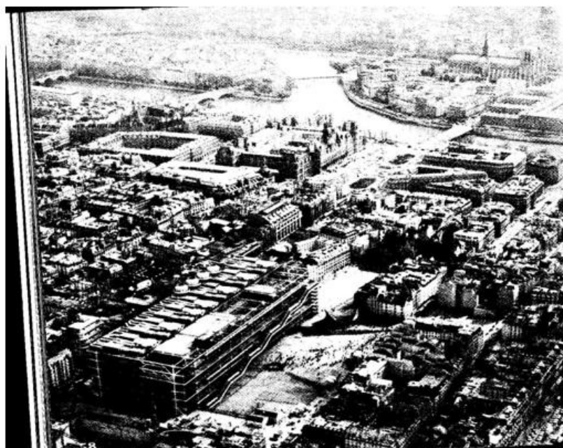
Figura N° 2. La ciudad supraterritorial se expande en forma difusa determinando áreas urbanas discontinuas y corredores

Fuente: extraída de La ciudad de la urbanidad (Rubén Pesis) se observan presencia de nuevos espacios, asociación de lugares, ciudades de bordes y en red.