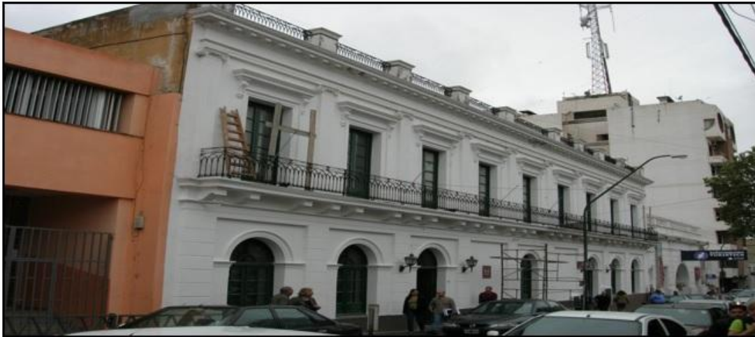
Figura 5. Área centro de la ciudad donde se observa la presencia de oficinas públicas. Tribunales, Turismo y Cultura Provincial, Banco Nación.

ejemplo los trabajos de Cristina Carballo sobre Buenos Aires (2002) 20 , de Adriano Rovira sobre Santiago de Chile (2002) 21 y de Oscar Sobarzo sobre Brasil (2002) 22 .