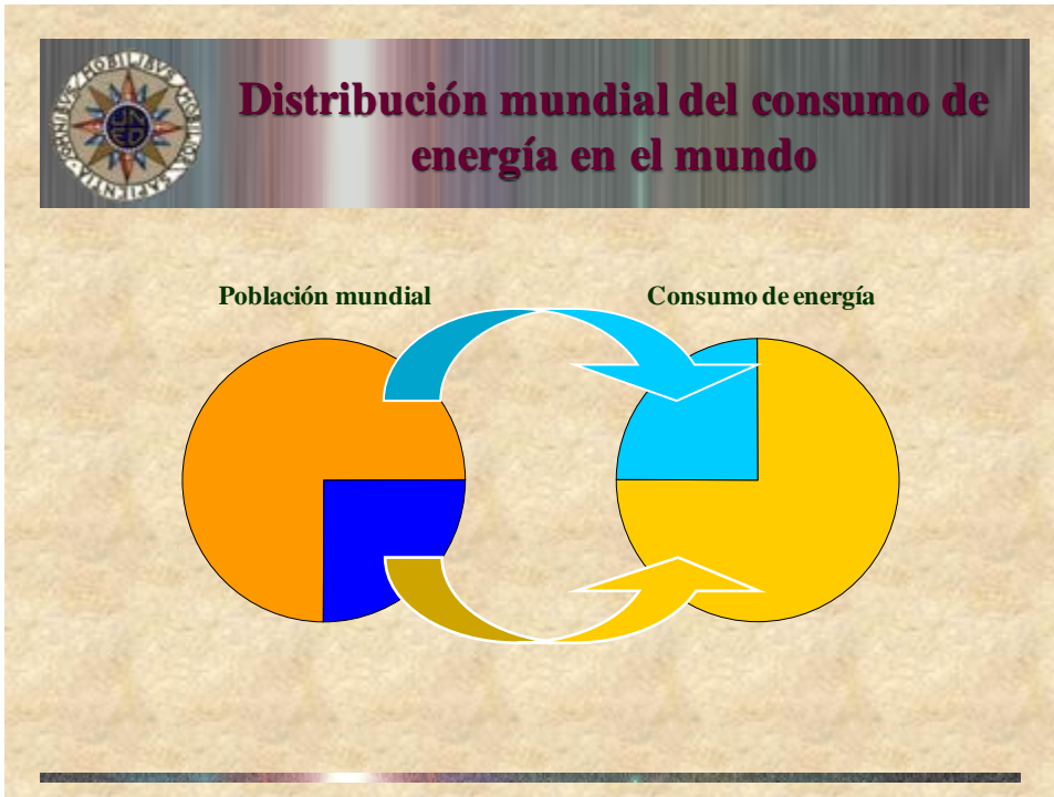
Fig. 2 Distribución mundial del consumo de energía.

La figura 3 representa un esquema que permite explicar el calentamiento global.