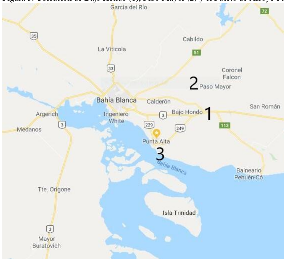
Figura 3. Ubicación de Bajo Hondo (1), Paso Mayor (2) y el Puerto de Arroyo Pareja (3)