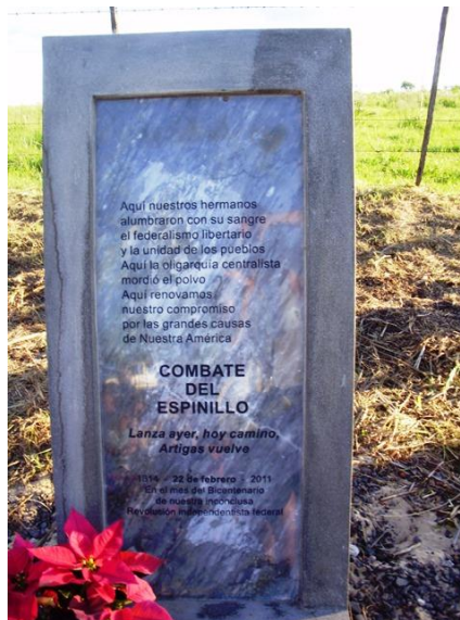
Combate del Espinillo – Referencias en La Picada