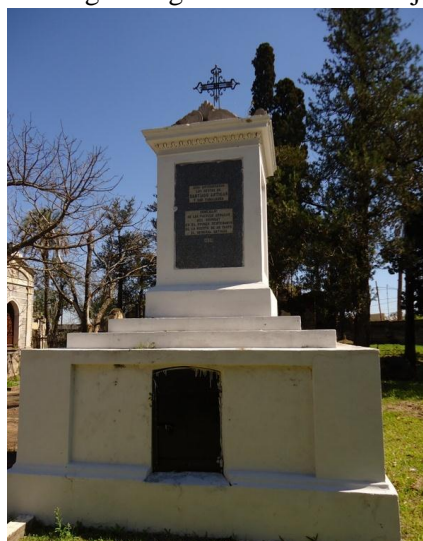
Éxodo Oriental – Ayuí – Concordia