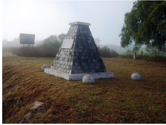
Combate del Espinillo – Arroyo homónimo – departamento Paraná