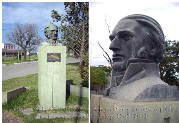
Monumento a Santiago Artigas - Cementerio viejo de Concordia